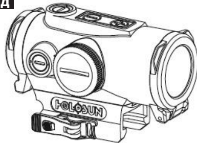
Рис. 1 Коллиматорный прицел HE530G-GR/RD.