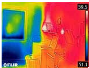
Неизолированная наружная стена