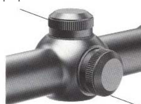
Правый пристрелочный винт